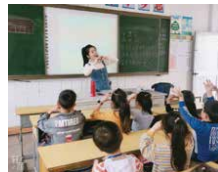
音乐走进外来民工子弟学校