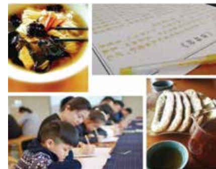
2019年3月24日以“一碗素面,一卷经书,一壶茶,一份爱”为主题的公益活动