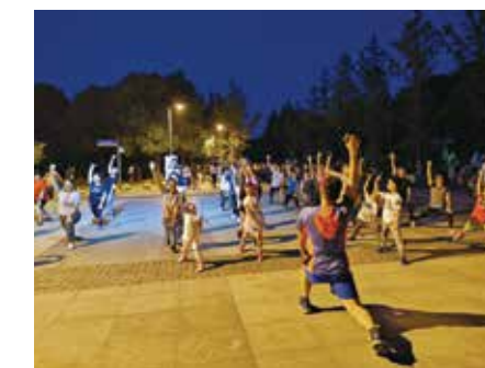
2019年5-9月上海嘉定地区组织多场公益夜跑活动