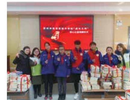
2019年1月25日彩香中学捐书活动