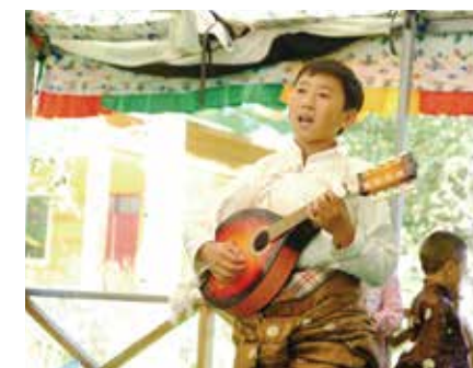
2019年7月26-29日青海亲子夏令营