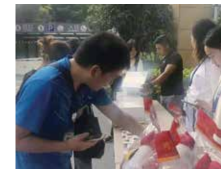
2019年9月9日参加腾讯“小红花市集联合义卖活动”