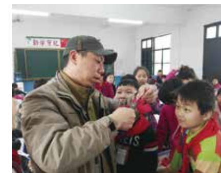
剪纸艺术走进外来民工子弟学校