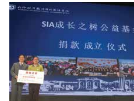
2018年11月25日SIA成长之树公益基金成立